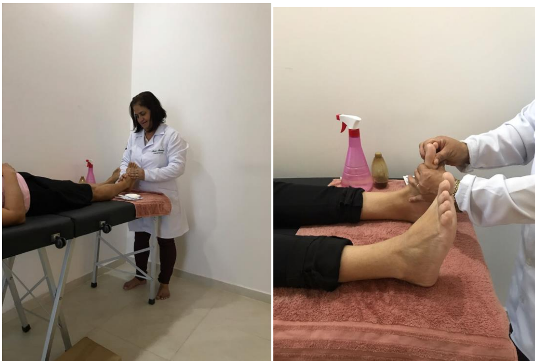
Figura 2 e Figura 3