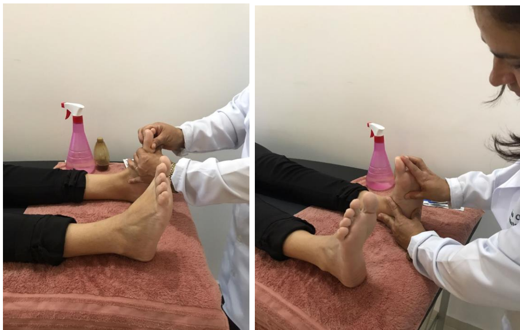
Figura 4 e Figura 5